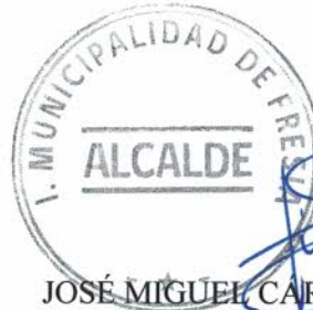
JOSÉ MIGUEL CARDENAS BARRÍA ALCALDE DE LA COMUNA