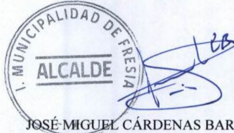
JOSÉ MIGUEL CÁRDENAS BARRÍA ALCALDE DE LA COMUNA